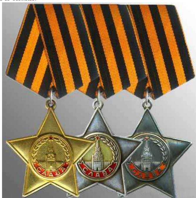
Орден Славы 3-х степеней

В годы Великой Отечественной войны, продолжая боевые традиции русской армии, 8 ноября 1943 года был учрежден орден Славы трех степеней. Его статус, так же, как и желто-черная расцветка ленты, напоминали о Георгиевском кресте. Затем Георгиевская лента, подтверждая традиционные цвета российской воинской доблести, украсила многие солдатские и современные российские наградные медали и знаки.