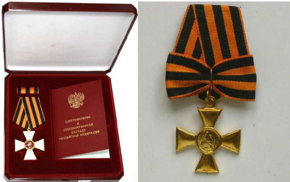
Орден Святого Георгия, утверждённый Екатериной II