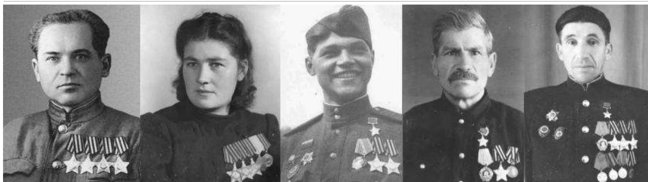
ГЕОРГИЕВСКАЯ ЛЕНТА И ОРДЕН СВЯТОГО ГЕОРГИЯ

Лучше всего убрать георгиевскую ленточку до следующего года или носить ее по особым датам – например, в день начала Великой Отечественной войны или в день окончания Сталинградской битвы.