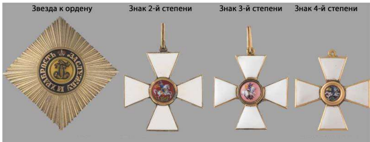
Звезда и знаки к ордену Св. Георгия

Первая степень ордена имела три знака: крест, звезду и ленту, состоящую из трех черных и двух оранжевых полос, которая носилась через правое плечо под мундиром. Вторая степень ордена также имела звезду и большой крест, который носился на шее на более узкой ленте. Третья степень – малый крест на шее, четвертый – малый крест в петлице.